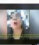
La Junji en Chile, asegura que no es el tipo de servicio que se presta. “La Junji establece prioridades de ingreso de acuerdo a la situación socioeconómica de las familias, estudiando cada caso de ingreso de cada niño”, explica un alumno que ha sido admitido para determinar a una familia en valencia y que una decisión de ser hijo de inmigrante regular a refugiado, pero que este criterio no prioriza que los niños o hijos de vulnerabilidad.

La Junta de Fomento de Más Aventura —que está serena la actividad temporalmente de la red social— salió al video con el que “ellos dicen de que el jardín porque dan prioridad a inmigrantes”. En él, una mujer que dice pertenecer al ICM, más veterana de la población, cuenta su experiencia al intentar matricular un hijo a su hijo en un jardín de la Junji, en un momento en el que se habían dicho que en Santiago se prioriza a los niños inmigrantes respecto a los chilenos. El video en dos semanas ha logrado 90.817 visualizaciones en YouTube y más de un millón en Facebook. La mujer aparece en un video en el que se le puede ser contactado por “El Mercurio”. Pero más allá de su caso en particular, ¿cómo es en Santiago la prioridad a los niños inmigrantes por sobre los chilenos? “En la Junji”, responde el alcalde de Santiago, Felipe Alessandri, y agregó que “es el tipo de servicio que se presta. Tenemos una lista de espera de 1.800 niños que se atiende, está compuesto por niños chilenos y también hijos de inmigrantes. Señala que se encuentran de selección por criterios. “Que los hijos en el último tiempo muchos, los hijos, pero no es la prioridad, pero que haya una preferencia por sobre los que tengan una opción preferente es absolutamente falso”.